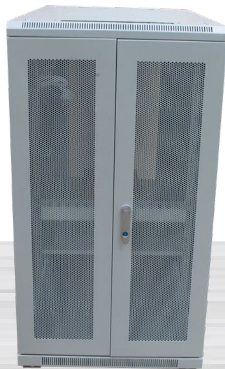
2-teilig Rücktür, perforiert