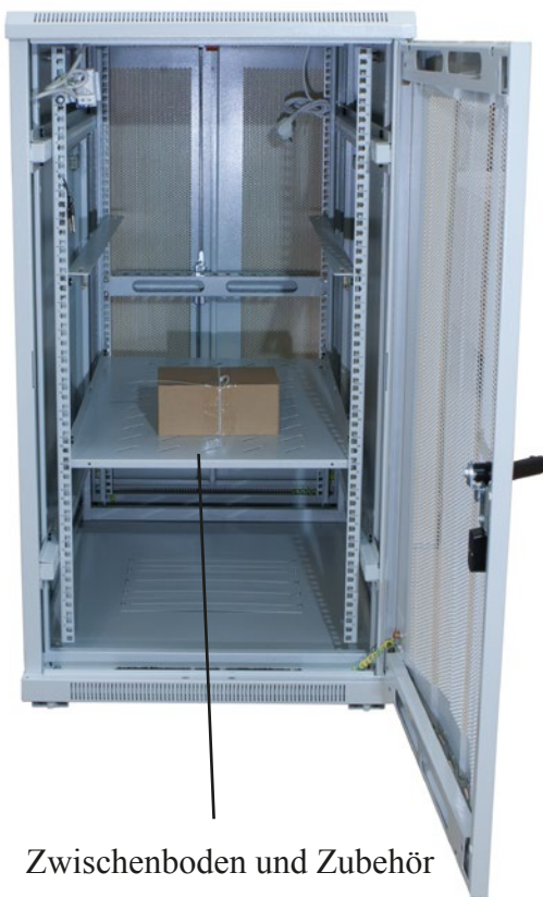
Zwischenboden und Zubehör