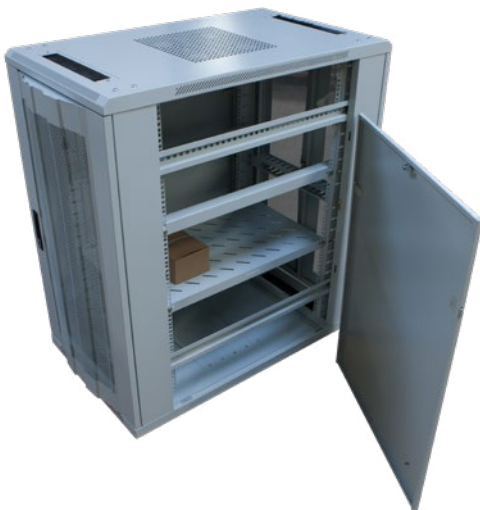
Schnellabnehmbare Seitenwand mit Schloss