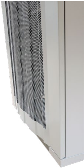
Geschwungene perforierte Fronttüre