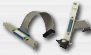
Adapterkabel mit Zusatzslotblech von 20-pol. Stiftstecker auf 25-polige Sub-D-Buchse ADQ-AP-D25F-cPCI (Art.-Nr. 111755) oder ADQ-AP-D25F-PCIe (Art.-Nr. 111756)