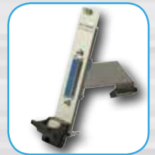
Adapterkabel mit Zusatz-Slotblech für 16 TTL-Digital-I/Os