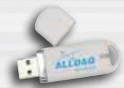
Dokumentation und Treiber-Software