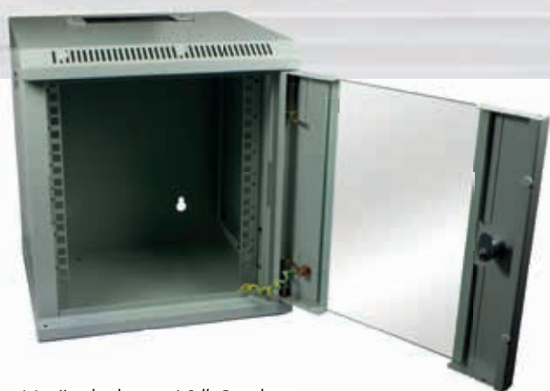
Veränderbare 10" Streben Türen umbaubar