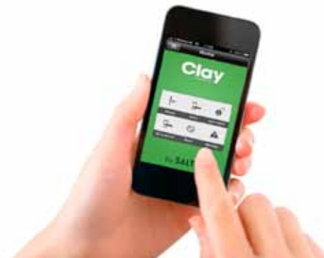
Mobiles Zutrittsmanagement via App

Mit der Clay App für iOS, Android und Windows stehen alle wichtigen und sicherheitsrelevanten Funktionen von My-Clay.com auch für unterwegs und in Echtzeit zur Verfügung: z. B. verlorene ClayTags sofort sperren und Türen fernöffnen, falls ein Mitarbeiter seinen persönlichen ClayTag vergessen hat oder ein externer Dienstleister spätabends noch Zutritt erhalten soll.