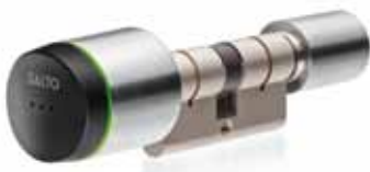
Die Clay Zylinder sind in diversen Ausführungen lieferbar

Die batteriebetriebenen elektronischen Clay Zylinder sind äußerst kompakt und durch den einfachen Austausch des Türzylinders schnell montiert. Ideal auch für Objekte, in denen es nicht möglich oder gewünscht ist, Türbeschläge anzubringen (z. B. Denkmalschutz). Für innen wie außen geeignet und mit verschiedenen Oberflächen erhältlich.