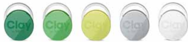
Die ClayTags sind in fünf verschiedenen Farben lieferbar

ClayTags sind elektronische Schlüssel, die alle Türen des Systems öffnen, an denen sie berechtigt sind. Wenn ein ClayTag verloren geht, kann er umgehend in My-Clay.com oder der Clay App gesperrt werden. Die im Inneren verwendete RFID-Technologie setzt eine AES-Verschlüsselung für hohe Sicherheit ein. Als sogenanntes passives Element benötigen die ClayTags keine Batterien, sondern erhalten ihre Energie von den Clay Zylindern und Beschlägen. In Weiß und Grau sowie drei verschiedenen Grüntönen erhältlich.