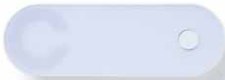
Der ClayIQ bildet die Zentrale des Zutrittsystems

Der ClayIQ verbindet als Zentrale die Clay Zylinder und Beschläge mit der Online-Plattform My-Clay.com – und das komplett kabellos und ohne Konfigurationsaufwand. Einfach den ClayIQ mit der Halterung horizontal oder vertikal an der Wand befestigen, Strom anschließen und im geschützten persönlichen My-Clay Account aktivieren. Der ClayIQ verbindet sich selbstständig über das Mobilfunknetz mit dem Internet. Die Installation ist überall dort möglich, wo ein Mobiltelefon Empfang hat. Die Entfernung zu den Clay Zylindern und Beschlägen sollte maximal 10 Meter betragen.