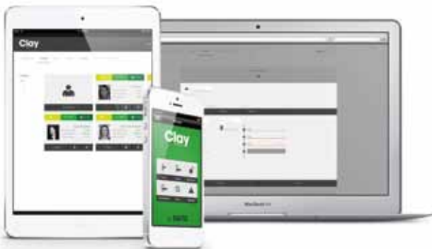
Zutrittsverwaltung via Online-Plattform

Komplett ohne Softwareinstallation lässt sich nach dem geschützten Log-in auf My-Clay.com das gesamte Zutrittsystem steuern und verwalten: z. B. Zutrittsrechte anlegen oder aktualisieren, ClayTags sperren, Mitteilungen über die Batteriestände der Clay Zylinder und Beschläge abrufen u. v. m. Alles höchst komfortabel, übersichtlich und in Echtzeit.