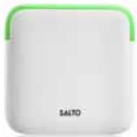
Die Clay Wandler sind in den Farben Weiß und Schwarz erhältlich

Die Clay Wandler beziehen all jene Türen in die Zutrittslösung ein, an denen kein Clay Zylinder oder Beschlag angebracht werden kann, z. B. automatische Türsysteme an Haupteingängen, Schranken oder Aufzüge etc. Für den Innen- und Außeneinsatz geeignet. Die Clay Wandler benötigen wegen der Ansteuerung der Türen als einzige Clay Komponente eine Verkabelung.