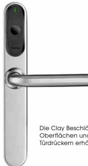
Die Clay Beschläge sind in verschiedenen Oberflächen und mit unterschiedlichen Türdrückern erhältlich

Die batteriebetriebenen elektronischen Clay Beschläge lassen sich mit wenig Aufwand an nahezu allen Türen installieren, innen wie außen. Zur optimalen Anpassung an das Gebäudedesign stehen eine Vielzahl von Oberflächenvarianten und unterschiedliche Drückergarnituren zur Auswahl. Darüber hinaus können die Clay Beschläge das Offenstehen von Türen oder ein unberechtigtes Öffnen erkennen und melden.